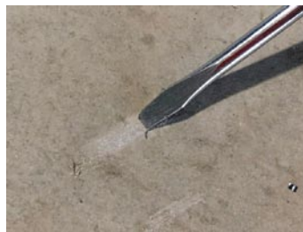
施工可能な下地の状態