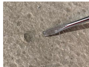
研磨が必要な下地の状態